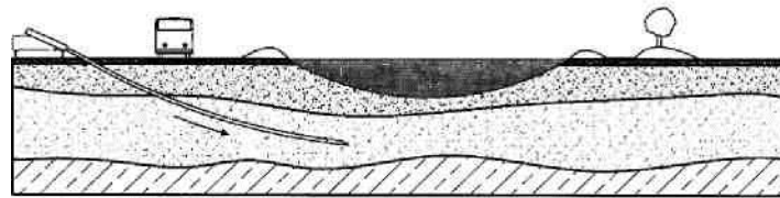
Rys.1) Przewiert pilotażowy

Istotnym czynnikiem warunkującym możliwość wykonania przewiertu sterowanego jest kombinacja dwóch parametrów: długości i średnicy rurociągu. Dodatkowym czynnikiem są lokalne warunki geologiczne oraz przeszkody terenowe, usytuowanie słupów energetycznych oraz innych sieci podziemnych a nade wszystko koryta cieków, gdzie ze względu na przepisy, wynikające z odpowiednich ustaw i rozporządzeń oraz norm i wytycznych, niemożliwe jest wykonanie rurociągów metodami tradycyjnymi (wykopu otwartego). Zależnie od długości i średnicy rurociągu dobiera się odpowiednie wiertnice.